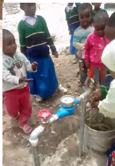
Arrivée de l'eau dans l'école !