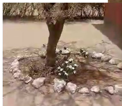
Lettre de remerciement