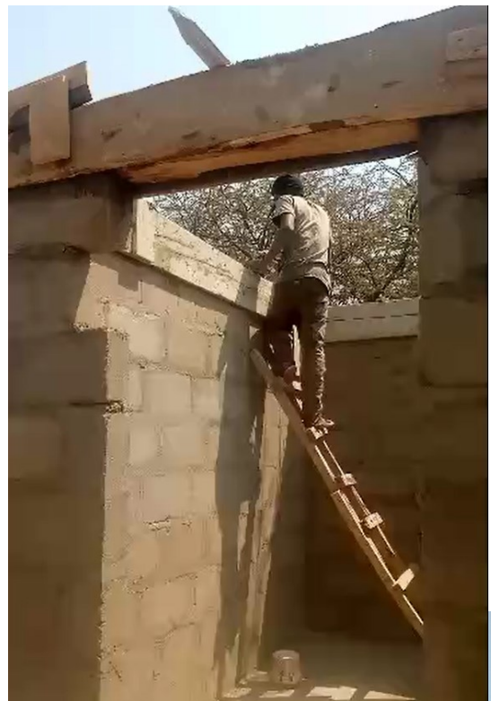
Début des travaux