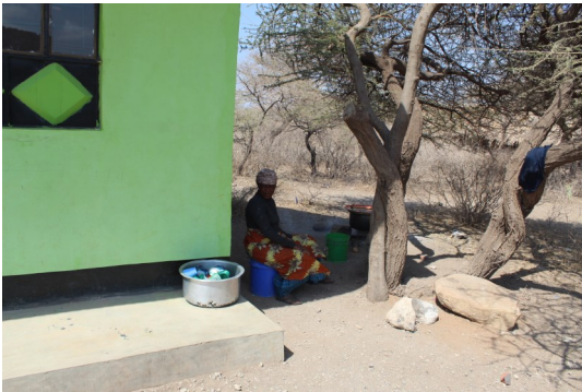
Avant : Cuisine en plein air

L'excédent de financement 2023 / 2024 a permis d'anticiper la 2ème phase et de commencer les travaux de construction, en dur, de la cuisine.