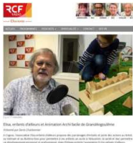
Photo prise pendant le direct, sur la page Facebook de RCF 16