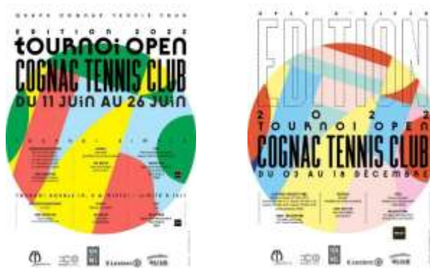
Affiches des 2 Tournois 2022

A l'occasion de ses 2 tournois Open de juin et de décembre 2022, le CTC a prélevé 1 € sur les droits d'inscription de chaque joueur participant. Les responsables du Club ont ainsi pu remettre, par 2 fois, un chèque à ELISA Enfants d'Ailleurs. Un grand merci à eux et aux joueurs !