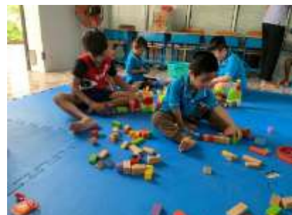
Les enfants du Centre Social de Nuoc Ngot