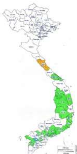
Cartographie des filleuls