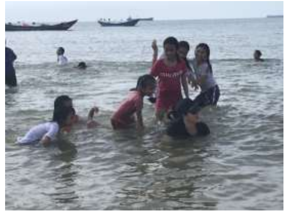
Journée plage pour des filleules de Hué, avant le départ en vacances d'été