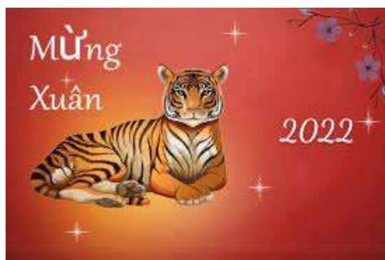
Année du Tigre

Un de nos filleuls a dessiné ce superbe croquis de Saïgon à main levée ; nous ne résistons pas au plaisir de le partager avec vous :