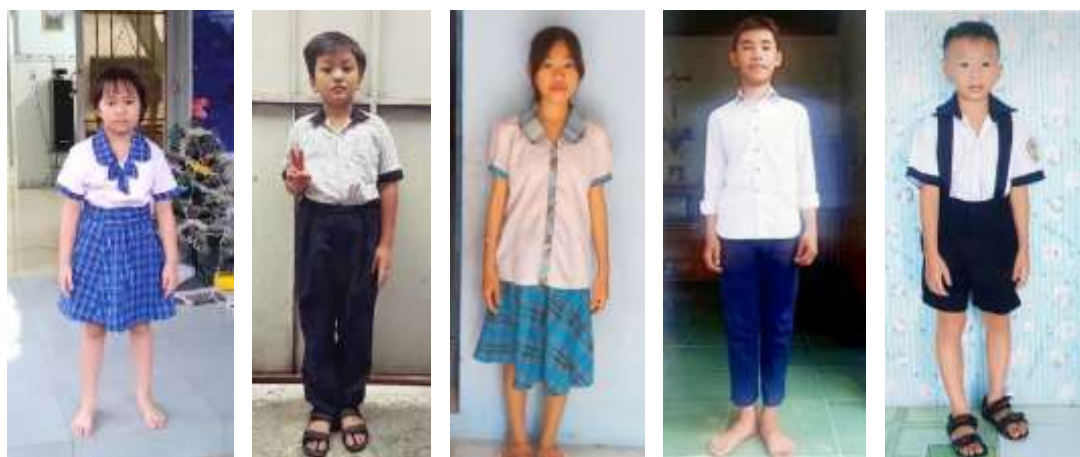
Quelques enfants en attente de parrainage à MATD

Au mois d'avril, ELISA Enfants d'Ailleurs a financé, à la demande des Sœurs de la Maison d'Amour, l'aménagement d'une « salle de lait », avec réfrigérateur, à l'école maternelle Mai Khoi à Ho Cho Minh Ville.