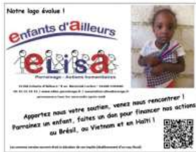
Les différents encarts publiés dans Charente Libre