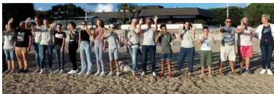
Equipe de bénévoles

Deux expositions ont été présentées au public :