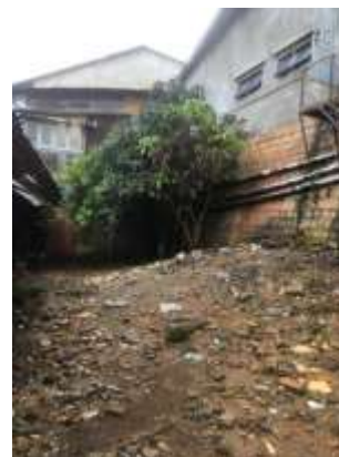
Etat actuel avant les travaux