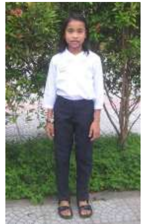
Quelques enfants en attente de parrainage à Hué