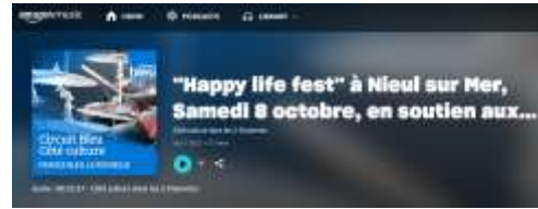
Site Crédit Mutuel du Sud-Ouest et site Amazon Music

France Bleu La Rochelle a consacré, pendant toute une semaine, son émission « les talents de l'Ouest » au groupe Burning Lips qui a, bien sûr, fait la promotion de l'événement.