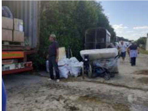
Photos du chargement du container et article de Charente Libre