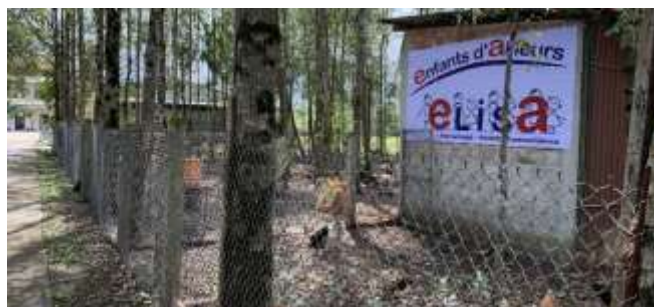
Les travaux de construction

Il faut noter que de plusieurs sponsors / mécènes du bassin rochelais ont accompagné financièrement le projet ; de même :