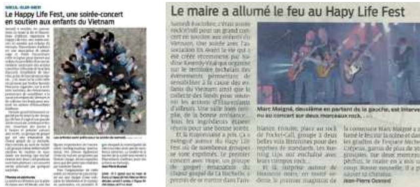
Articles de Sud-Ouest en amont (5 octobre) et en aval (12 octobre) du HLF

Le quotidien Sud-Ouest a publié des articles sur le HLF :