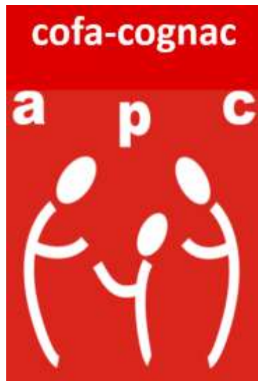
COFA Cognac (16)