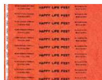
Affiche / flyer, billet d'entrée et bracelet

Trois groupes régionaux (Hope, Pocket Call et Burning Lips) se sont succédé sur la scène de l'Espace Michel Crépeau, chacun intervenant, bénévolement, pendant 75 à 90 minutes, avant de conclure par plusieurs morceaux joués en commun (avec la participation de M. Maire de Nieul-sur-Mer à la guitare), puis de laisser la place et les platines à DJ Moule.