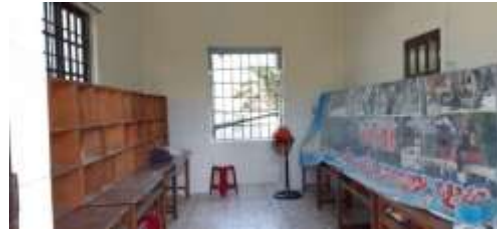
Travaux à Hué