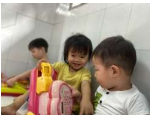
Enfants de MATD et ramassage scolaire devant l'établissement

Globalement, le bilan des parrainages est très largement positif ; il est valorisant d'accompagner ainsi de jeunes enfants défavorisés pour qu'ils puissent s'épanouir tant dans leur vie personnelle que dans leur vie active.