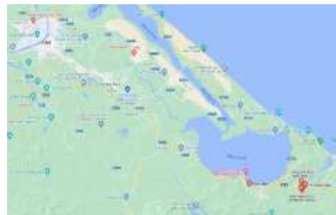
Localisation du Centre Social de Nuoc Ngot