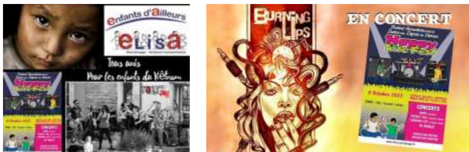
Site Pocket Call et site Burning Lips

Plusieurs sites Internet et pages Facebook ont relayé la manifestation :