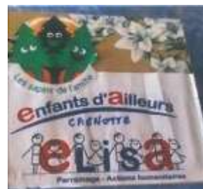
Soirée anniversaire et cagnotte

Nous avons espoir que le (magnifique) projet de classe de musique pour enfants défavorisés à Belo Horizonte, mis en stand-by ces derniers mois, puisse redémarrer ... Malheureusement, il est aujourd'hui abandonné, la crise de la Covid 19 étant passée par là et nos interlocuteurs brésiliens ayant jeté l'éponge !