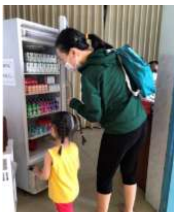
Ecole maternelle Mai Khoi